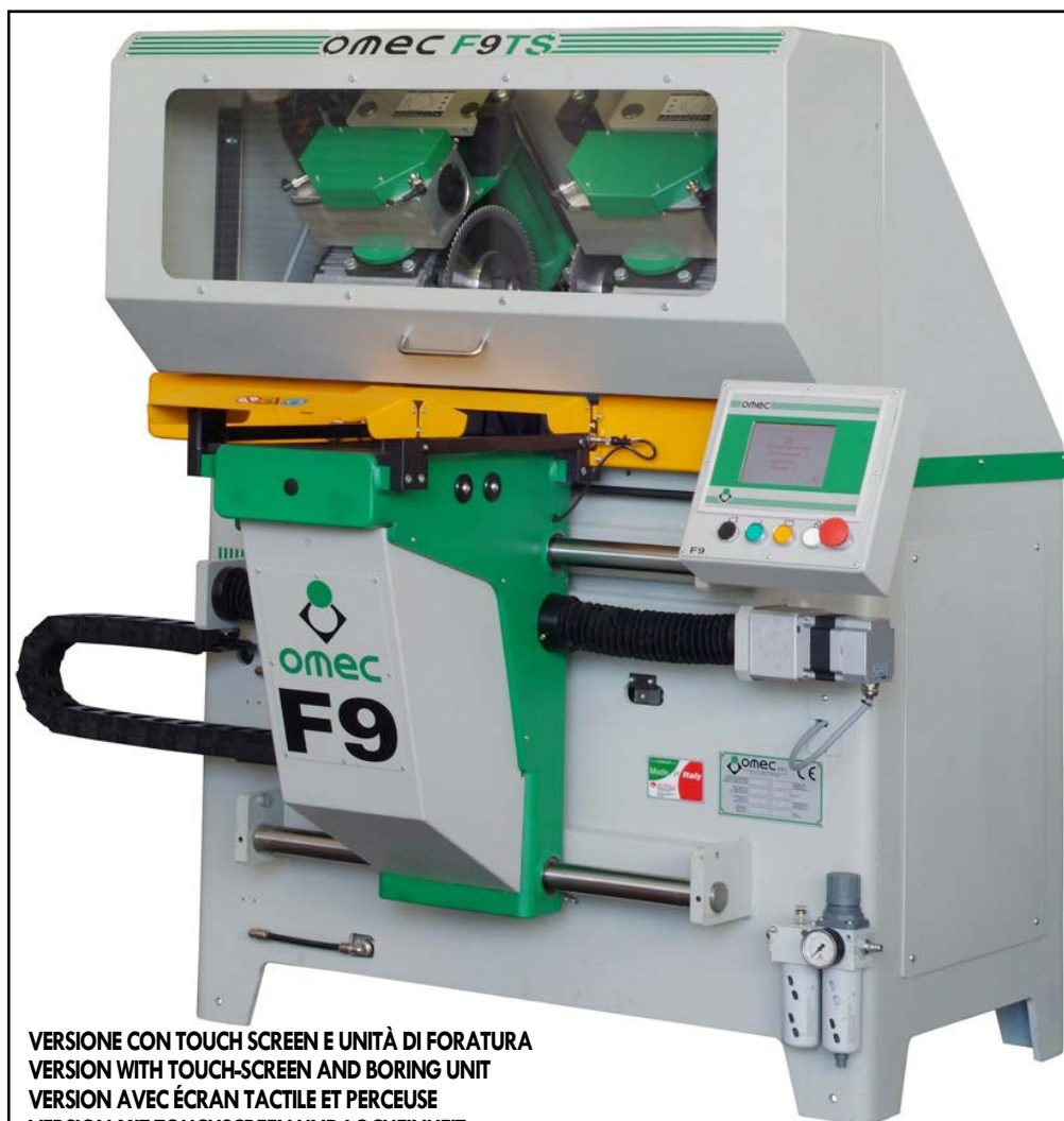
VERSIONE CON TOUCH SCREEN E UNITÀ DI FORATURA VERSION WITH TOUCH-SCREEN AND BORING UNIT VERSION AVEC ÉCRAN TACTILE ET PERCEUSE VERSION MIT TOUCHSCREEN UND LOCHHEINHEIT VERSIÓN CON PANTALLA TÁCTIL Y UNIDAD DE PERFORACIÓN

La fresadora automática OMEC F9 se usa para realizar ensambladuras paralelas en armazones para puertas, ventanas y diferentes partes de muebles. Sus características son su gran facilidad de uso, su alta precisión y su rapidez para realizar el trabajo. La máquina consta de una unidad fresa y de dos unidades sierra que permiten la realización de ensambladuras y, el corte de 45°. Las piezas se trabajan individualmente de forma automática. El bloqueo de las piezas se lleva a cabo de forma automática cada vez que empieza un ciclo de trabajo, lo mismo para el desbloqueo de las piezas cuando acaba el ciclo. Los mandos se realizan mediante un cuadro de control situado en la máquina. El modelo F9 es dirigido por un sistema de control numérico (CNC) que se encarga de la gestión del ciclo de trabajo